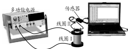
图1 验证法拉第电磁感应定律装置