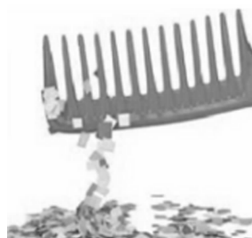
图1 塑料梳子吸引轻小纸屑

象的细节.发现该奇特现象后,接下来可以引导学生思考,带电梳子吸引纸屑的力究竟有什么样的特点,才导致这一瞬间“跳变”现象的发生呢?经过观察后学生可能会提出猜想,塑料梳子给纸屑的力一定与距离有关,距离越小,力就越大.知道库仑定律的学生可能会提出,塑料梳子给纸屑的力是不是也和距离的平方成反比呢?如果不是,那应该依赖于距离的几次方呢?